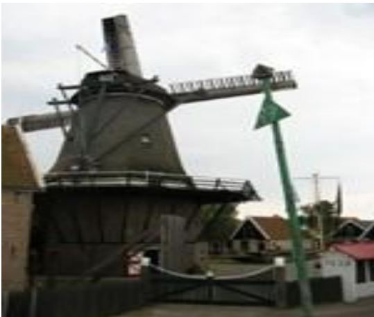
Dans les Iles de la Frise

Depuis KIEL sur la côte Baltique vous rejoindrez CUXHAVEN à l'embouchure de l'Eider après une agréable navigation dans le canal de Kiel, voie navigable de 98km, 100m de large, 13m de profondeur qui relie la mer du Nord à la Baltique. De là vous ferez une halte sur l'île d'Helgoland puis vous longerez les îles de La Frise Occidentale qui constituent un archipel côtier sur la mer du Nord. On dénombre 7 îles habitées et plusieurs petits îlots déserts, qui appartiennent tous au parc national de la mer des Wadden. Les îles de la Frise se partagent entre les Pays-Bas et l'Allemagne, surnommées « Perles de la Mer », elles sont classées au Patrimoine mondial. Vous terminerez votre voyage à Le Helder situé à 80 km environ au nord d'Amsterdam.