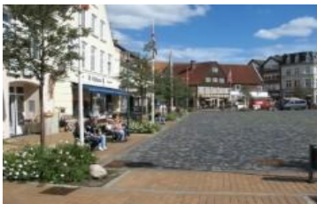
Rendsburg dans le canal