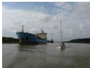
Dans le canal

Voie navigable de 98km, 100m de large, 13m de profondeur qui relie la mer du Nord à la Baltique néanmoins bucolique, elle est empruntée par de nombreux navires, cargos de plusieurs milliers de tonnes comme par des bateaux de plaisance.