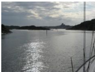
Arrivée sur Marstrand

La côte est rocheuse : une succession de dizaines d'îles et des chenaux qui permettent de naviguer plusieurs heures sans voir la mer. La navigation doit être très précise du fait des innombrables roches, souvent à fleur d'eau, qui pavent les chenaux. Chaque village de pêcheurs est très typé, a son propre caractère. Dans les archipels la culture « îlienne » est très marquée.